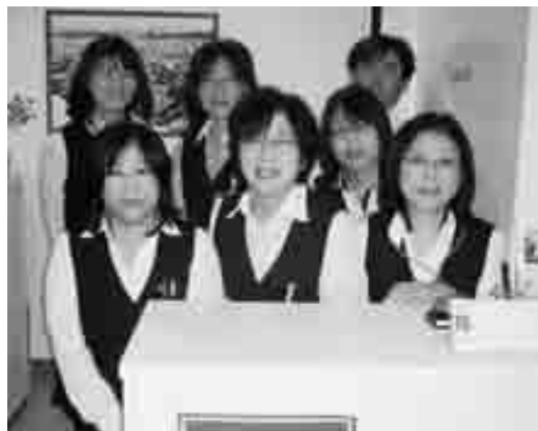
23年度業務数（相談件数）

本年4月の診療報酬改定により、「患者サポート体制加算」が算定できることとなりました。病院内における退院調整看護師とMSWの役割が確立し始めたとともに、現在の社会的背景により果たすべき業務も増えていると感じています。医療の機能分担を推進し、患者や家族の皆さんが満足・安心して当院を退院できる支援体制を一層充実させていきたいと思っています。