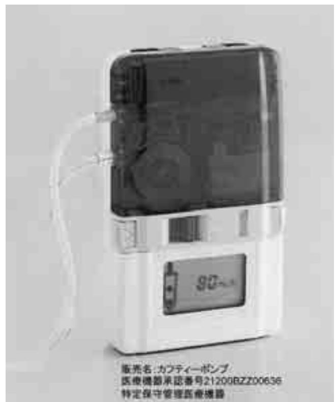
販売名:カフティーポンプ 医療機器承認番号21200BZ00636 特定保守管理医療機器

時間の院内指導で在宅へ戻られるケースも少なくありません。さらに実施する本人や介護する家族の方も高齢化しており、「カフティーポンプ」を利用される方の約7割が60歳以上です。ですから、安全面はもちろんのこと操作方法がさらに簡便でわかりやすいポンプの要望が多く、これが今後の課題です。また、このような状況では在宅移行後の訪問看護ステーションを中心とした専門スタッフの皆様の積極的な管理に関する援助やフォロー、ご家族へのサポート体制が不可欠であると感じております。一人でも多くの訪問看護師の皆様にカフティーポンプ等、機器の正しい取扱い方法や指導のポイントを知って頂く機会として、説明会や機器の実習・デモを実施しています。また、多職種が関わる医療連携ではその役割を明確にしながらの情報交換が重要となりますが、テルモは医薬品・医療機器メーカーとして患者様・ご家族の方が自身で安全・簡単に使用できる在宅向け医療機器の製造開発、情報提供等を通して地域の在宅医療を支えるチーム医療の一員としての役割を果たしていきたいと考えています。